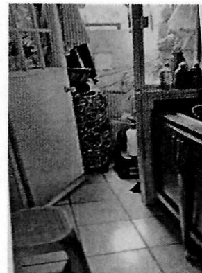
Figuras 1-3. Se observa el departamento señalado en el escrito de denuncia.

En virtud de lo antes expuesto, esta Entidad considera procedente emitir la presente resolución, de conformidad con el artículo 27 fracción VI de la Ley Orgánica de esta Procuraduría, por imposibilidad material, en virtud de que dejaron de existir los hechos denunciados, al ya no encontrarse los ejemplares caninos en el lugar de la denuncia.