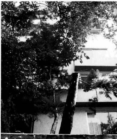
Figura 1. Se observa el individuo arbóreo motivo de denuncia.

En este sentido, de las constancias que obran en el presente expediente, se desprende que personal de esta Subprocuraduría llevaron a cabo una visita de reconocimiento de hechos, de acuerdo a lo establecido en el artículo 15 BIS 4 fracción IV de la Ley Orgánica de esta Entidad, diligencia durante la cual el personal actuante fue atendido por el administrador de la Unidad Habitacional donde se encuentra el sujeto forestal, quien manifestó que en ese lugar no se llevó a cabo el derribo de algún pino, lo cual fue constatado por el personal actuante, toda vez que no se observaron tocones. No obstante lo anterior, durante el recorrido se observó que un individuo arbóreo de la especie Cupressus lusitanica Mill. (cedro blanco), de aproximadamente seis metros de altura presenta un desmoche no reciente de uno de sus dos troncos codominantes, lo cual no representa una amenaza para su sobrevivencia.