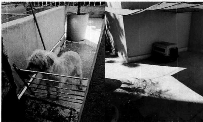
Fotografías 1 y 2: se observa al ejemplar canino motivo de denuncia, así como su sitio de alojamiento, recipientes para alimento y bebida a libre acceso.