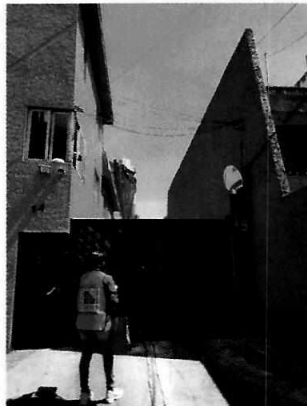
Figura 1. Vista de la entrada al complejo habitacional señalado en el escrito de denuncia.

En seguimiento de lo anterior, mediante correo electrónico se le solicitó a la persona denunciante señalara el número interior donde se encuentran alojados los ejemplares caninos motivo de denuncia; al respecto, manifestó que desconoce dicha información, aunado a que hay entre 15 y 20 departamentos en el complejo habitacional señalado en su denuncia. Por lo anterior no se cuenta con elementos materiales para continuar con la investigación.