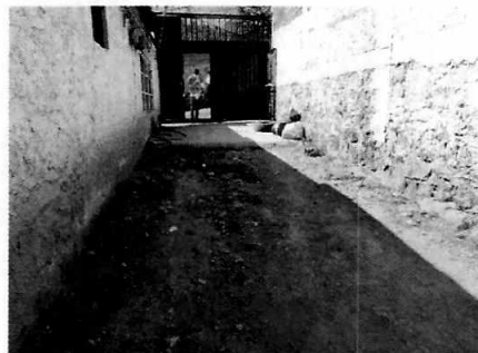
Figuras 1-3. Se observa la fachada y el interior del inmueble señalado como lugar de los hechos denunciados.

Medellín 202, piso 4, colonia Roma Sur Alcaldía Cuauhtémoc, C.P. 06000, Ciudad de México Tel. 5265 0780 ext 12011 Y 12400