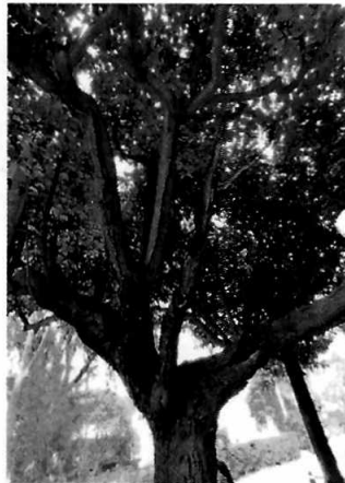
Figuras 1-5. Se observan los dos individuos arbóreos motivo de denuncia, los cuales presentan más del 80% de su follaje.

En virtud de lo antes expuesto, esta Entidad considera procedente emitir la presente resolución, de conformidad con el artículo 27 fracción VI de la Ley Orgánica de esta Procuraduría, por imposibilidad legal, al no verse visto comprometida la sobrevivencia del arbolado.