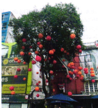
Figura 1. Individuo arbóreo motivo de denuncia.

Aunado a lo anterior, y con la finalidad de contar con mayores elementos, se citó a comparecer a la persona presuntamente responsable de los hechos, quien se presentó en las oficinas de esta Procuraduría, manifestando que las lámparas observadas en el individuo arbóreo motivo de denuncia no se encuentran fijadas, clavadas, pegadas, amarradas, enrolladas y/o sujetas al tallo o a las ramas del árbol motivo de denuncia, por lo que no existe alguna afectación que pudiera generar problemas estructurales o fitosanitarios del mismo.