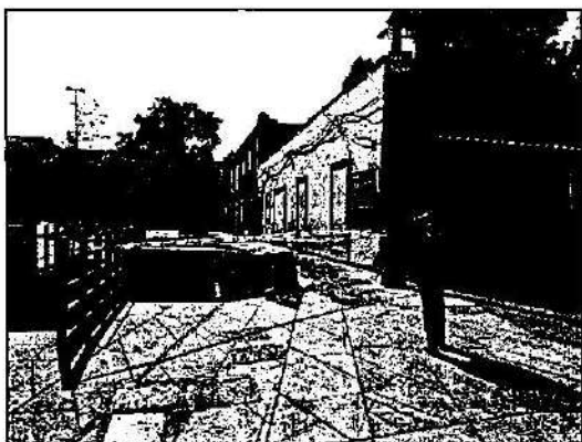
Imagen: Área con barreras que delimitan retiro de adoquín, un tocón arbóreo, así sellos de suspensión del INVEA/CDMX.

Cabe mencionar que las barreras de protección comentadas con antelación, contaban con sellos de suspensión de actividades, impuestos por parte del Instituto de Verificación Administrativa de la Ciudad de México, con número de procedimiento INVEACDMX/OV/DU/365/2022 y fecha de 03 de junio de 2022. -----