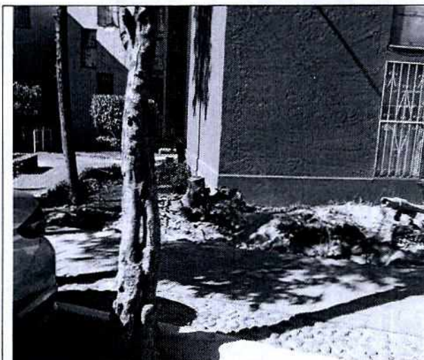
Visualización del tocón localizado entre los edificios Diego Rivera e Ignacio Coronel, de la Unidad Habitacional Pedregal de Carrasco.

Asimismo, presentó 8 fotografías del individuo arbóreo que cayó sobre uno de los automóviles estacionados al interior de la Unidad Habitacional, en las cuales además se puede observar a personal del H. Cuerpo de Bomberos, realizar el corte y segmentación del árbol en comento.