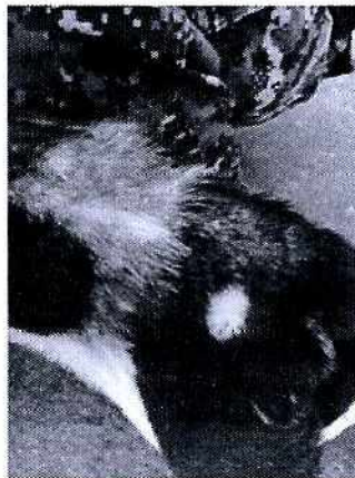
Figuras 1 y 2. Detalles de las lesiones y zonas alopécicas.