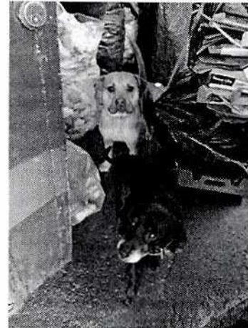
Figura 2. Ejemplares denunciados.

Es de resaltar que, en el Acuerdo de Admisión, que fue enviado por correo electrónico a la persona denunciante, se le hizo de conocimiento que contaba con un término de seis días hábiles para aportar las pruebas que estimara pertinentes en la investigación de los hechos, lo anterior conforme al artículo 90 del Reglamento de la Ley Orgánica de la Procuraduría Ambiental y del Ordenamiento Territorial de la Ciudad de México; sin embargo durante el procedimiento de investigación, no fueron proporcionados elementos de prueba que pudieran determinar incumplimiento a la normatividad en materia de bienestar animal.