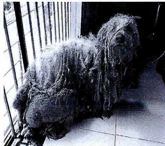
Fotografía. Vista del canino evaluado.