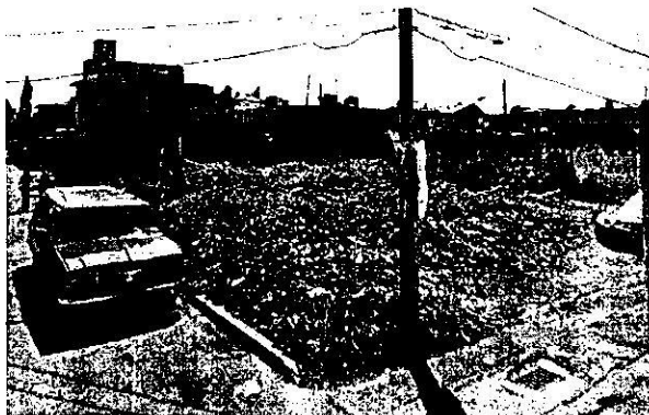
Octubre 2009