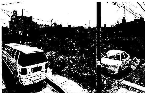
Febrero 2015