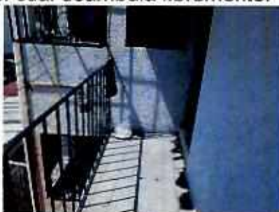
Fotografía 2. Vista del sitio en el cual anteriormente se encontraba el ejemplar canino motivo de denuncia

Por lo tanto, concluyéndose que con las acciones realizadas por la persona responsable del animal motivo de la denuncia, se cumple con las condiciones adecuadas de bienestar respecto al alimento, agua, higiene, movilidad, alojamiento y comportamiento. Por lo anterior se da por concluida la investigación de conformidad con el artículo 27 fracción VII de la Ley Orgánica de esta Procuraduría.