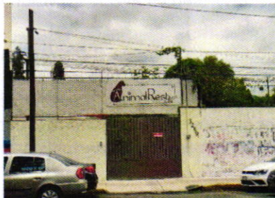
Figura 2. Vista del establecimiento mercantil motivo de denuncia.

En seguimiento a la denuncia, personal adscrito a esta Entidad realizó una segunda visita de reconocimiento de hechos, durante la cual desde el espacio público no se constató emisión de partículas a la atmósfera provenientes de las actividades realizadas al interior del establecimiento mercantil motivo de denuncia.