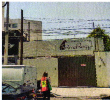
Figura 1. Vista del establecimiento mercantil motivo de denuncia.

En ese sentido, personal de esta Entidad realizó una visita de reconocimiento de hechos durante la cual desde el espacio público no se constató la emisión de partículas a la atmósfera provenientes de las actividades realizadas al interior del establecimiento mercantil de referencia; no obstante, se tuvo la atención de una persona que se ostentó como empleada de dicha negociación mercantil y a quien se le notificó el oficio PAOT-05-300/200-540-2021.