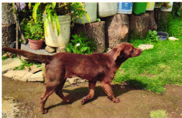
Figura 4. Ejemplar canino “Loky”.

En seguimiento de lo anterior, personal de esta Subprocuraduría llevó a cabo una nueva visita de reconocimiento de hechos con la finalidad de dar seguimiento a las recomendaciones antes mencionadas, diligencia durante la cual se hizo de conocimiento del personal actuante que hace un tiempo se llevó a cabo la adopción de los ejemplares caninos “Frijol” y “Loky”, por lo que actualmente reciben los cuidados de bienestar correspondientes y presentan una condición corporal ideal de acuerdo a su talla.