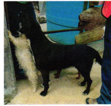
Figuras 1, 2 y 3. Ejemplares caninos y felinos motivo de denuncia.

Derivado de lo observado, se realizaron las siguientes recomendaciones: