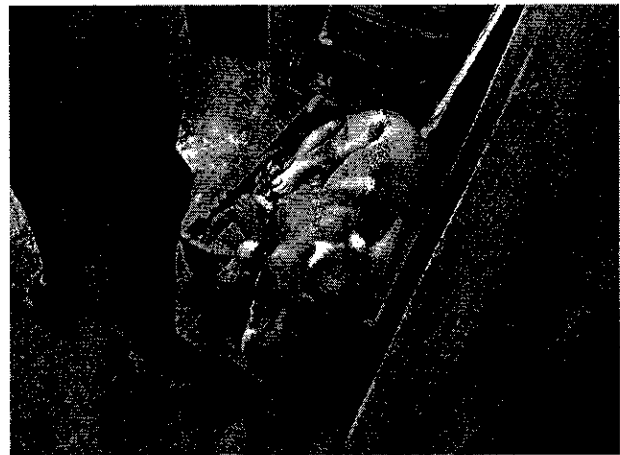
Imágenes muestran ejemplar canino motivo de denuncia

Cabe señalar que en el acuerdo de admisión, debidamente notificado, se le otorgó a la persona denunciante un término de 6 días hábiles a efecto de que presentara las pruebas que estimara pertinentes en la investigación de los hechos, lo anterior en términos del artículo 90 del Reglamento de la Ley Orgánica de la Procuraduría Ambiental y del Ordenamiento Territorial de la Ciudad de México, sin embargo en el expediente del presente procedimiento no obran constancias que acredite la presentación de alguna prueba en la que evidencie actos de maltrato animal. De tal suerte que no haber prueba en contrario, es posible dar por concluida la presente investigación.