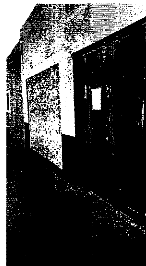
Sitio señalado en escrito de denuncia ubicado en calle Navojoa número 35, colonia San Lorenzo Xicotencatl, Alcaldía Iztapalapa.

Medellín 202, piso 4, colonia Roma Sur Alcaldía Cuauhtémoc, C.P. 06700, Ciudad de México Tel. 5265 0780 ext 12011 y 12400