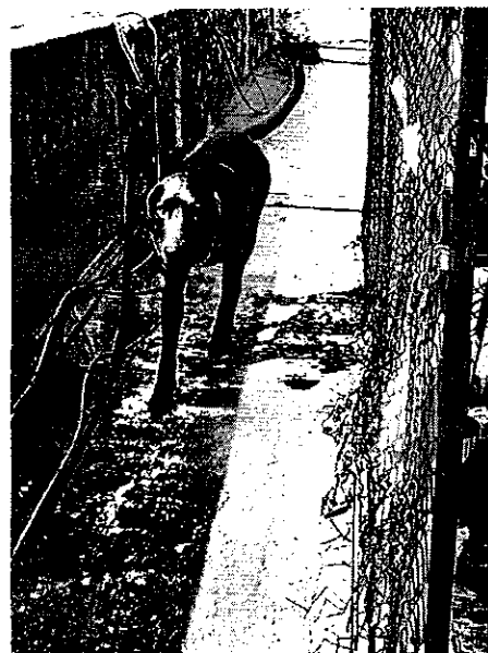
Fotografías 1 -2. Muestra ejemplar canino raza labrador libre, localizado en Boulevard Puerto Aéreo, número 336, colonia Moctezuma 2 Sección, Alcaldía Venustiano Carranza.