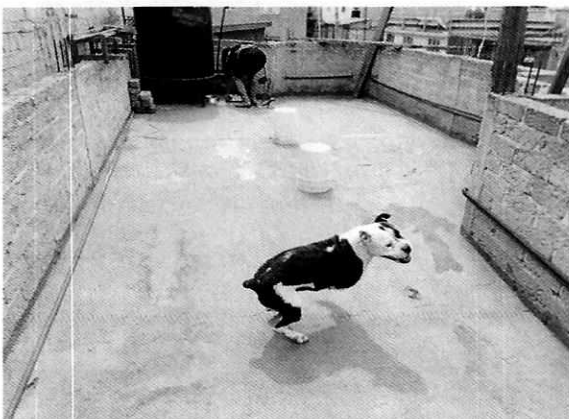
Fotografía 1.- Muestra al canino motivo de denuncia.