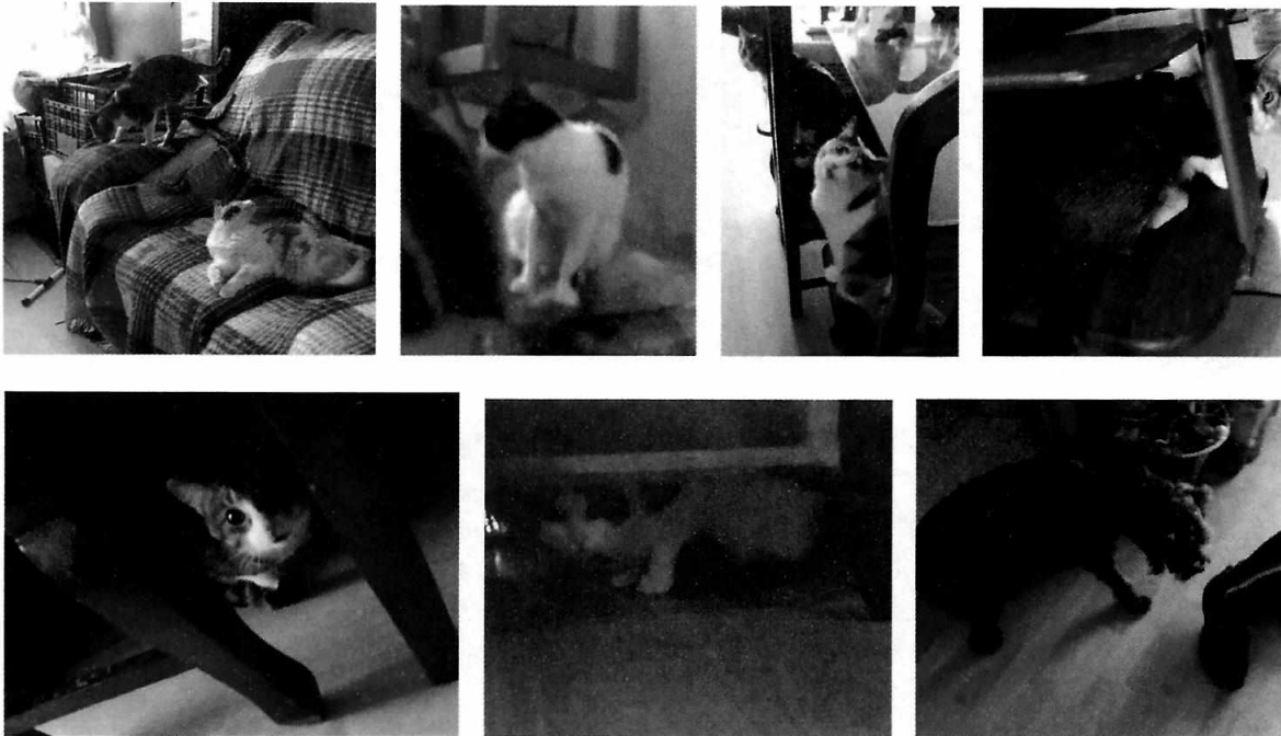
Figuras 1-7. Vista de los ejemplares felinos y el canino localizados en el inmueble motivo de denuncia.

sistemas inmunológicos a fin de evitar enfermedades graves y potencialmente mortales, por lo que durante el presente acto mostró las cartillas de vacunación correspondientes.