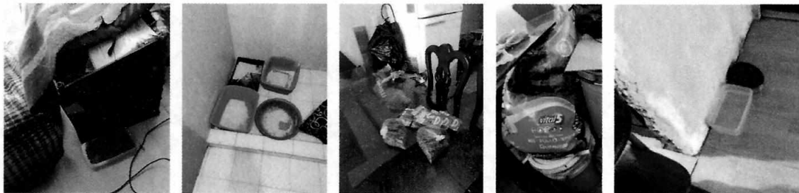
Figuras 8-12. Se advirtieron recipientes con agua y alimento, así como un costal de croquetas, sobres, y areneros.

Es de resaltar que, en el Acuerdo de Admisión, que fue enviado por correo electrónico a la persona denunciante, se le hizo de conocimiento que contaba con un término de seis días hábiles para aportar las pruebas que estimara pertinentes en la investigación de los hechos, lo anterior conforme al artículo 90 del Reglamento de la Ley Orgánica de la Procuraduría Ambiental y del Ordenamiento Territorial de la Ciudad de México; sin embargo durante el procedimiento de investigación, no fueron proporcionados elementos de prueba que pudieran determinar incumplimiento a la normatividad en materia de bienestar animal.