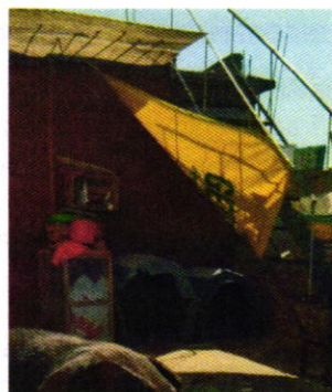
Figuras 1 y 2. Ejemplares caninos motivo de denuncia y sus sitios de alojamiento.

Es de resaltar que, en el Acuerdo de Admisión, que fue enviado por correo electrónico a la persona denunciante, se le hizo de conocimiento que contaba con un término de seis días hábiles para aportar las pruebas que estimara pertinentes en la investigación de los hechos, lo anterior conforme al artículo 90 del Reglamento de la Ley Orgánica de la Procuraduría Ambiental y del Ordenamiento Territorial de la Ciudad de México; sin embargo durante el procedimiento de investigación, no fueron proporcionados elementos de prueba que pudieran determinar incumplimiento a la normatividad en materia de bienestar animal.