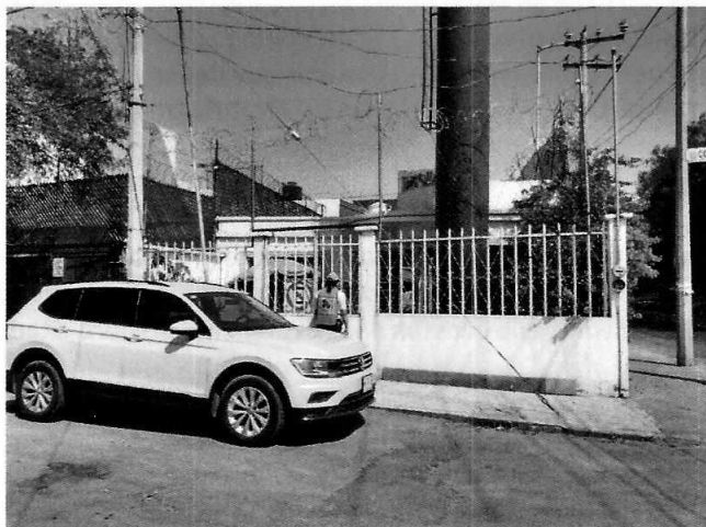
Fotografía 1. Se muestra fachada del sitio señalado como el de los hechos denunciados

En este sentido, de las constancias que obran en el presente expediente, se desprende que personal de esta Subprocuraduría llevó a cabo una visita de reconocimiento de hechos, de acuerdo a lo establecido en el artículo 15 BIS 4 fracción IV de la Ley Orgánica de esta Entidad, diligencia durante la cual una persona trabajadora del sitio donde se denunciaron los hechos objeto de la presente investigación, hizo de conocimiento al personal adscrito a esta Subprocuraduría que el ejemplar canino que fue señalado en el escrito de la denuncia, ya no se encontraba en el inmueble, lo anterior toda vez que el propietario del mismo, que también trabajaba en el inmueble, se lo llevó a su domicilio. Cabe señalar que el personal de la PAOT constató que efectivamente no había algún ejemplar con las características descritas en la denuncia al interior del domicilio en cuestión.