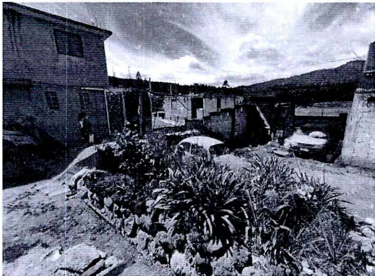
Imagen 1. Lugar en donde se encontraban los cánidos.

En este sentido, de las constancias que obran en el presente expediente, se desprende que personal de esta Subprocuraduría llevó a cabo una visita de reconocimiento de hechos, de acuerdo a lo establecido en el artículo 15 BIS 4 fracción IV de la Ley Orgánica de esta Entidad, diligencia durante la cual una persona habitante del lugar donde se denunciaron los hechos objeto de la presente investigación, hizo de conocimiento al personal adscrito a esta Subprocuraduría que los ejemplares caninos que fueron señalados en el escrito de la denuncia, ya no se encuentran en el inmueble, lo anterior toda vez que el propietario de los cánidos los reubicó, derivado de la molestia de los vecinos. Cabe señalar que el personal de la PAOT constató que efectivamente no había algún ejemplar con las características descritas en la denuncia al interior del domicilio en cuestión.