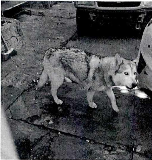
Imagen 1. Ejemplar canino de nombre "Nanao".