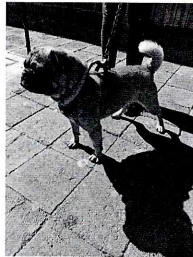
Imagen 2. Ejemplar canino de nombre "Jops".

Es de resaltar que, en el Acuerdo de Admisión, que fue enviado por correo electrónico a la persona denunciante, se le hizo de conocimiento que contaba con un término de seis días hábiles para aportar las pruebas que estimara pertinentes en la investigación de los hechos, lo anterior conforme al artículo 90 del Reglamento de la Ley Orgánica de la Procuraduría Ambiental y del Ordenamiento Territorial de la Ciudad de México; sin embargo durante el procedimiento de investigación, no fueron proporcionados elementos de prueba que pudieran determinar incumplimiento a la normatividad en materia de bienestar animal.