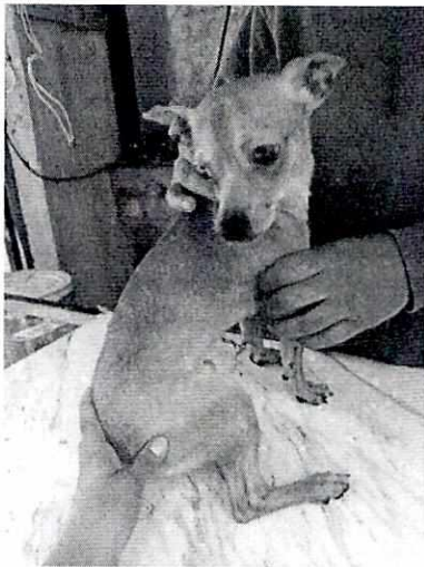
Imagen 1. Ejemplar canino de nombre "Rodolfo".