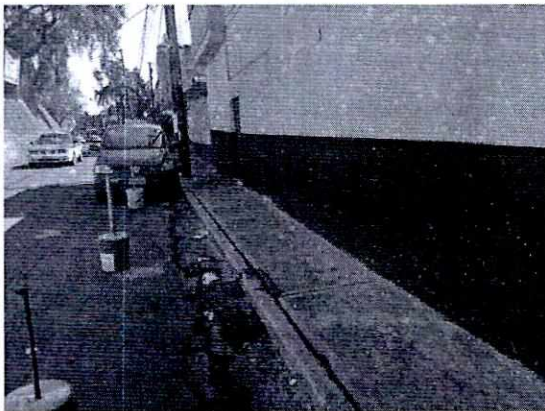
Imagen 1. Lugar en donde se encontraba el cánido.

En este sentido, de las constancias que obran en el presente expediente, se desprende que personal de esta Subprocuraduría llevó a cabo una visita de reconocimiento de hechos, de acuerdo a lo establecido en el artículo 15 BIS 4 fracción IV de la Ley Orgánica de esta Entidad, diligencia durante la cual una persona habitante del lugar donde se denunciaron los hechos objeto de la presente investigación, hizo de conocimiento al personal adscrito a esta Subprocuraduría que el ejemplar canino que fue señalado en el escrito de la denuncia, ya no se encontraba en la vía pública ni al interior del inmueble; lo anterior, toda vez que los dueños lo reubicaron del lugar.