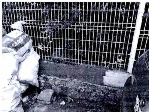
Imagen 2. Lugar en donde se encontraba el ejemplar canino.

En seguimiento de lo anterior, personal de esta Subprocuraduría informó a la persona denunciante que durante visita de reconocimiento de hechos no se constató la presencia del ejemplar canino en el sitio señalado en su denuncia, por lo que los hechos que motivaron su denuncia dejaron de existir.