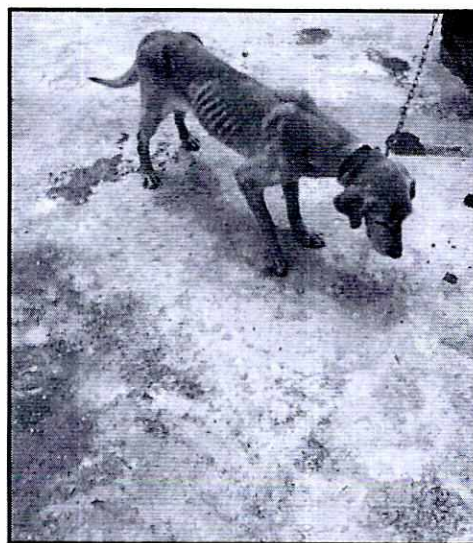
Imágenes 1 y 2. Vista de los ejemplares caninos, se observa la condición corporal delgada del ejemplar canino "Francesca"