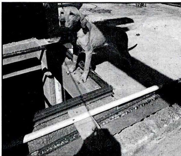
Imagen 3. Se observa que ejemplar canino "Francesca" ha recuperado su condición corporal.