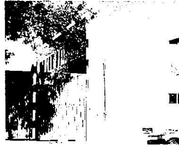
Reconocimiento de hechos 27 de enero de 2023, cuerpo constructivo norponiente, dos niveles de altura.

Si bien, los trabajos de construcción realizados en el predio de interés no incumplen con la zonificación asignada con forme al Programa Delegacional de Desarrollo Urbano para la Alcaldía Gustavo A. Madero, los trabajos descritos se realizaron sin contar con los permisos correspondientes ante la Alcaldía mencionada, por lo que corresponde a la Dirección General de Asuntos Jurídicos y de Gobierno de la Alcaldía Gustavo A. Madero sustanciar el procedimiento de verificación solicitado por la Dirección General