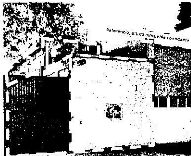
Google maps, Street view: mayo 2021, cuerpo constructivo norponiente, dos niveles de altura con instalaciones y tanques sobre la losa de planta baja

A efecto de mejor proveer, personal adscrito a esta Subprocuraduría realizó un estudio multitemporal comparando las imágenes obtenidas de la base cartográfica de Google maps con ayuda de su herramienta Street view y de las imágenes recopiladas durante los reconocimientos de hechos, se desprende que el cuerpo constructivo ubicado en el costado norponiente, a la fecha de mayo de 2021 contaba con dos niveles de altura, de los cuales la planta baja se desplanta hasta el alineamiento de la vía pública mientras que su planta alta únicamente se desplanta en una porción sobre la planta baja, y a la fecha del ultimo reconocimiento de hechos, se desprende que fueron realizados trabajos de ampliación en la planta alta al límite del alineamiento de la vía pública, es decir en la superficie total de la planta baja (se anexan imágenes para mayor referencia). -----