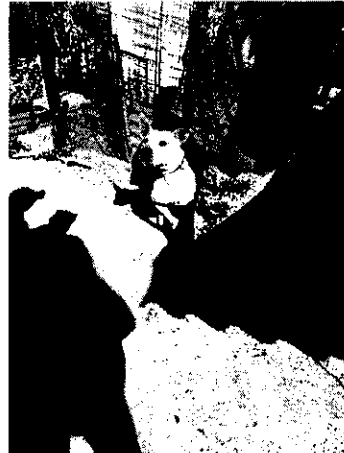
Fotografía 3-6.- Muestran ejemplares caninos de raza Pitbull, Mestizos, y beagle localizados en calle Monte Morelos Poniente número 35-B, colonia San Lucas Xochimanca, Alcaldía Xochimilco.