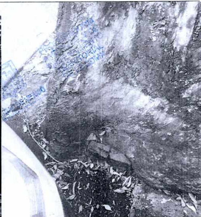
Fotografía 2. Vista de la base del tronco.