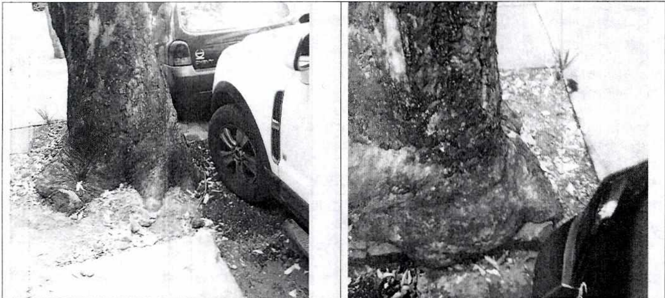
Fotografía 3 y 4. Vistas de la base del tronco del árbol en comento. No presenta ninguna afectación.

Por lo antes expuesto, mediante oficio se hizo del conocimiento del habitante del inmueble relacionado con los hechos denunciados, las disposiciones jurídicas ambientales aplicables al caso en particular, conminándolo a su debido cumplimiento.