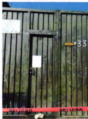
Figura 1. Lugar de los hechos denunciados.

En este sentido, de las constancias que obran en el presente expediente, se desprende que personal de esta Procuraduría llevó a cabo una visita de reconocimiento de hechos, de acuerdo a lo establecido en el artículo 15 BIS 4 fracción IV de la Ley Orgánica de esta Entidad, diligencia durante la cual desde el espacio público, se constató la existencia de un ejemplar canino, el cual se asomó a través de la ranura del zaguán del inmueble en comento; sin embargo, no fue posible localizar a su persona propietaria, motivo por el cual procedimos a fijar en la puerta del sitio de referencia mediante instructivo el oficio PAOT-05-300/200-1042-2021.