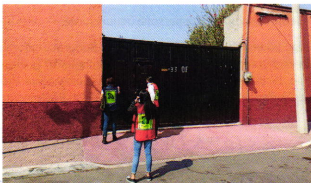
Figura 4. Lugar de los hechos denunciados.

En seguimiento de lo anterior, personal de esta Entidad realizó una tercer visita de reconocimiento de hechos, diligencia durante la cual una persona habitante del lugar donde se denunciaron los hechos objeto de la presente investigación, hizo de conocimiento al personal adscrito a esta Subprocuraduría que los ejemplares caninos que fueron señalados en el escrito de la denuncia, ya no se encuentran en el inmueble, lo anterior toda vez que fueron retirados del mismo por su persona propietaria, quien solamente acudía al lugar de referencia con la finalidad de proporcionarles agua y alimento. Cabe señalar que el personal de la PAOT constató que efectivamente no había algún ejemplar con las características descritas en la denuncia al interior del domicilio en cuestión.