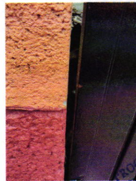
Figuras 2 y 3. Lugar de los hechos denunciados.

Medellín 202, piso 4, colonia Roma Sur Alcaldía Cuauhtémoc, C.P. 06000, Ciudad de México Tel. 5265 0780 ext 12011 Y 12400