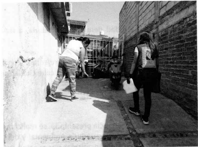
Fotografías 1 y 2.- Lugar de los hechos denunciados donde no se constató la presencia de ningún canino.

En virtud de lo antes expuesto, esta Entidad considera procedente emitir la presente resolución, de conformidad con el artículo 27 fracción VI de la Ley Orgánica de esta Procuraduría, por imposibilidad material, en virtud de que dejaron de existir los hechos denunciados, al ya no encontrarse el ejemplar canino en el lugar de la denuncia.