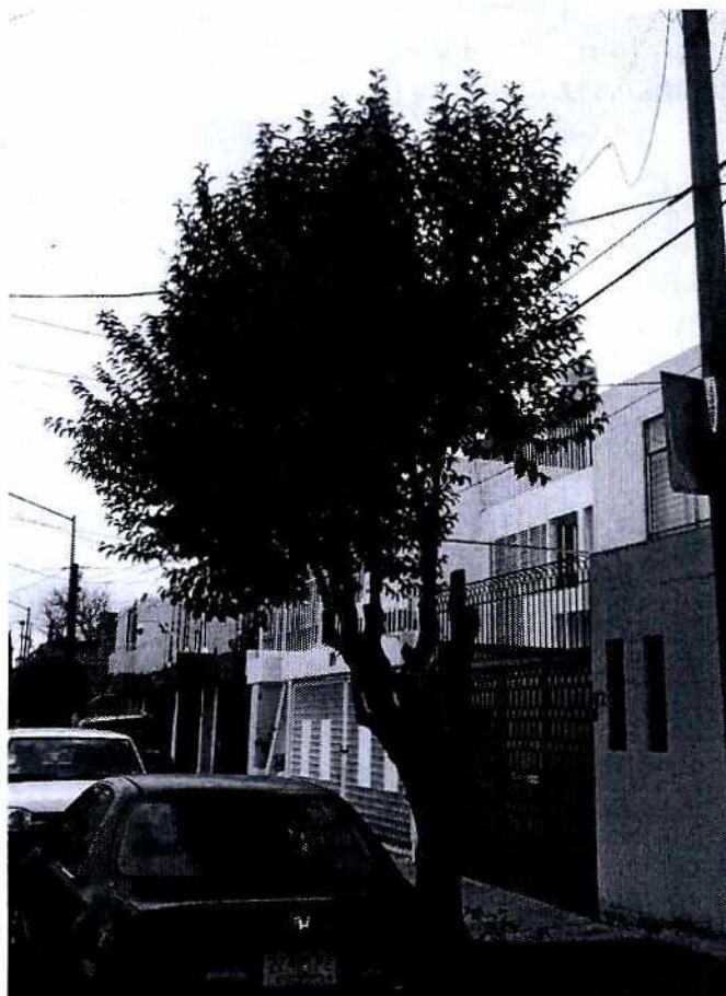
Fotografía 1. Vista general del sujeto arbóreo motivo de investigación.

En este sentido, esta autoridad no cuenta con elementos de convicción que permitan señalar al presunto responsable de verter sustancias tóxicas al individuo arbóreo localizado en calle Conmutador, frente al inmueble número 112, de la colonia Sinatel, Alcaldía Iztapalapa; por lo cual, es necesario hacer del conocimiento de la persona denunciante, que en caso de que cuente con algún elemento probatorio que permita identificar al presunto responsable de los hechos denunciados, podrá presentar la denuncia penal en términos del artículo 345 BIS del Código Penal para el Distrito Federal (actual Ciudad de México), que a la letra dice: "Se le impondrán de tres meses a cinco años de prisión y de 500 a 2,000 días multa, al que derribe, tale, o destruya parcialmente u ocasione la muerte de uno o más árboles" .