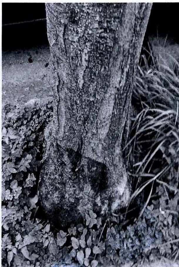
Fotografía 2. Vista de la base del tronco, se observa un cambio en su coloración.