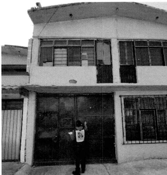
Fotografía 1.- Lugar de los hechos denunciados.

En este sentido, de las constancias que obran en el presente expediente, se desprende que personal de esta Subprocuraduría llevó a cabo una visita de reconocimiento de hechos, de acuerdo a lo establecido en el artículo 15 BIS 4 fracción IV de la Ley Orgánica de esta Entidad, diligencia durante la cual una persona habitante del lugar donde se denunciaron los hechos objeto de la presente investigación, hizo de conocimiento al personal adscrito a esta Subprocuraduría que el ejemplar canino que fue señalado en el escrito de la denuncia, ya no se encuentra en el inmueble, lo anterior toda vez que lo resguardaron en otro domicilio con la finalidad de darle mayores atenciones y mayor espacio de alojamiento. Cabe señalar que el personal de la PAOT constató que efectivamente no había algún ejemplar con las características descritas en la denuncia al interior del domicilio en cuestión.