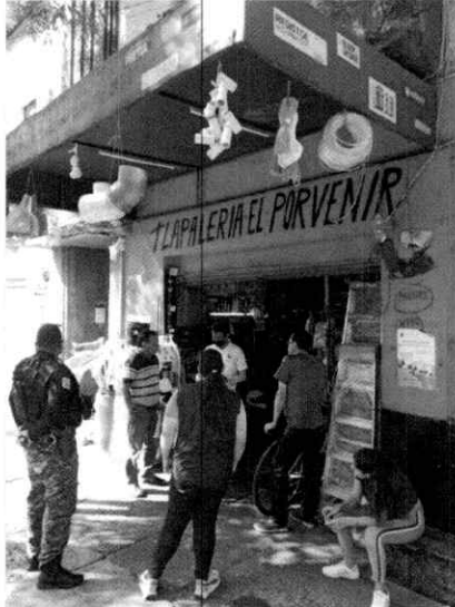
Fotografía 1.- Lugar de los hechos.