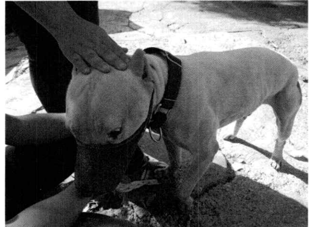
Fotografía 2.- Ejemplar denunciado.

En seguimiento de lo anterior, personal de esta Subprocuraduría llevó a cabo una nueva visita de reconocimiento de hechos con la finalidad de dar seguimiento a las recomendaciones antes mencionadas, constatando que la persona encargada del cuidado del canino llevó a cabo las recomendaciones realizadas por personal de esta Entidad y por iniciativa propia decidió mantener al ejemplar dentro del inmueble, con la finalidad de evitar el uso del bozal.