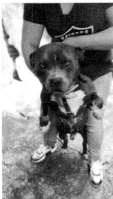
Fotografía 1.- Ejemplar denunciado que responde al nombre de "Chato".

En seguimiento de lo anterior, personal de esta Subprocuraduría dio seguimiento a las recomendaciones antes mencionadas, constatando que la persona encargada del cuidado del canino llevó a cabo las recomendaciones realizadas por personal de esta Entidad y por iniciativa propia decidió proporcionar paseos diarios de al menos 1 hora.