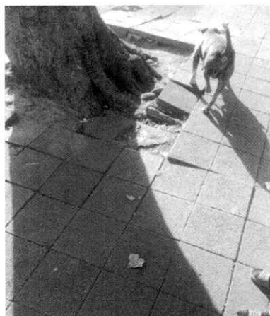
Fotografías 2 y 3.- Evidencia de los paseos que se proporcionan al canino.

En virtud de lo antes expuesto, esta Entidad considera procedente emitir la presente resolución, de conformidad con el artículo 27 fracción VII de la Ley Orgánica de esta Procuraduría, por el cumplimiento voluntario de las disposiciones jurídicas en materia de bienestar animal por parte de la persona responsable del canino.