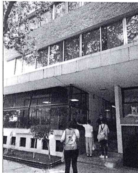
Figuras 1 y 2. Ubicación del sitio motivo de la denuncia, el ubicado en calle Chiapas 142, colonia Roma Norte, Alcaldía Cuauhtémoc.

Es de resaltar que, en el Acuerdo de Admisión, que fue enviado por correo electrónico a la persona denunciante, se le hizo de conocimiento que contaba con un término de seis días hábiles para aportar las pruebas que estimara pertinentes en la investigación de los hechos, lo anterior conforme al artículo 90 del Reglamento de la Ley Orgánica de la Procuraduría Ambiental y del Ordenamiento Territorial de la Ciudad de México; sin embargo durante el procedimiento de investigación, no fueron proporcionados elementos de prueba que pudieran determinar incumplimiento a la normatividad en materia de bienestar animal.