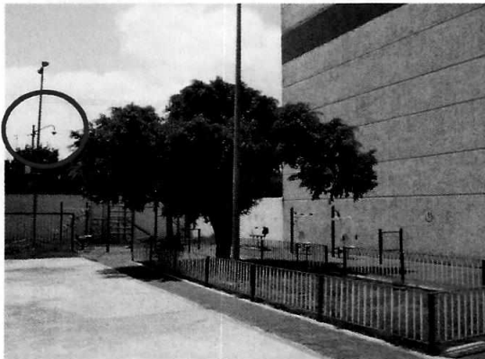
Figura 1. Se observa el individuo arbóreo motivo de denuncia, el cual ha recuperado su follaje.

En este sentido, de las constancias que obran en el presente expediente, se desprende que personal de esta Subprocuraduría llevaron a cabo una visita de reconocimiento de hechos, de acuerdo a lo establecido en el artículo 15 BIS 4 fracción IV de la Ley Orgánica de esta Entidad, diligencia durante la cual el personal actuante fue atendido por la persona administradora de dicha Unidad Habitacional, quien manifestó que se trata de un árbol localizado dentro de un área verde dentro de la unidad, mismo que durante la administración del año 2020 fue podado a fin de liberar la visibilidad de una cámara de seguridad pública. Sin embargo, se constató durante la presente visita que dicho sujeto forestal de la especie Ficus benjamina L. (Ficus) de aproximadamente 4 metros de altura, no presenta indicios de podas recientes, aunado a que se observa una copa vigorosa derivado de brotes epicórmicos.