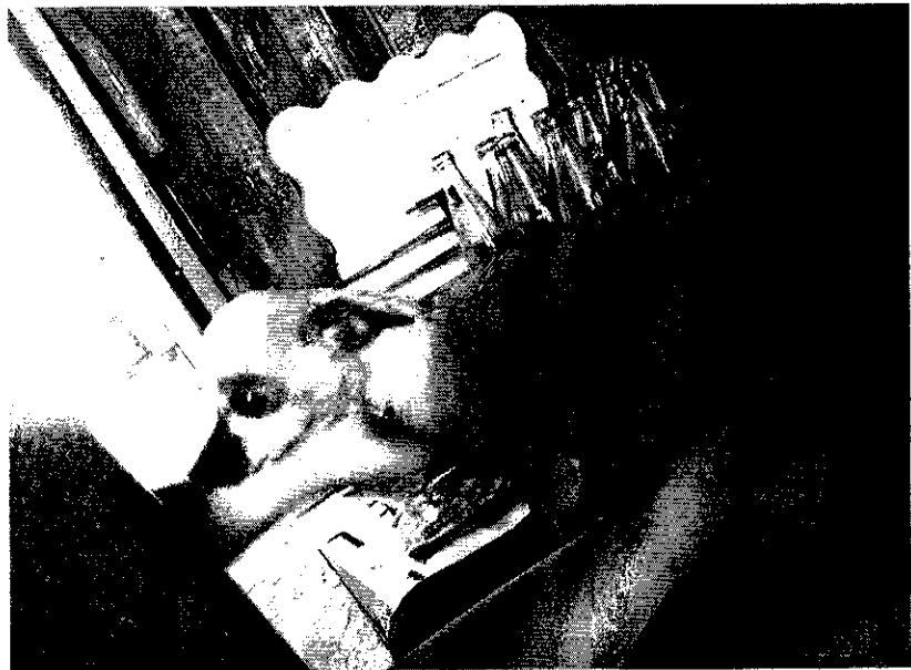
Fotografías 4-5. Muestran cartillas de vacunación y ejemplar motivo de denuncia

Por lo anterior mediante oficio, notificado mediante correo electrónico, se solicitó a la persona denunciante aportara elementos que permitieran identificar los actos de maltrato animal, indicando que se debería responder dentro de los cinco días hábiles, contados a partir el día siguiente en el que fue notificado el oficio referido, en el entendido de que si la solicitud no era desahogada en el término establecido, esta Subprocuraduría analizaría la conclusión de la investigación. Al respecto, la persona denunciante contestó el correo electrónico, sin embargo, no aportó mayores elementos que nos permitieran continuar con la investigación.