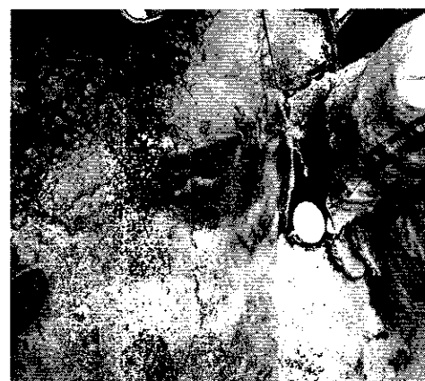
Fotografías 1-3. Se muestra el sitio referido en el escrito de denuncia, localizado en calle Florines número 176, colonia Aquiles Serdán, Alcaldía Venustiano Carranza.

Medellín 202, piso 4, colonia Roma Sur Alcaldía Cuauhtémoc, C.P. 06700, Ciudad de México Tel. 5265 0780 ext 12011 y 12400