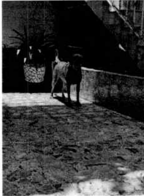
En la imagen se aprecia al canino "Oddy".

acuerdo a su edad, para reforzar sus sistemas inmunológicos a fin de evitar enfermedades graves y potencialmente mortales.