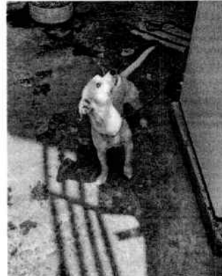
En la imagen se observa al canino "Parda".