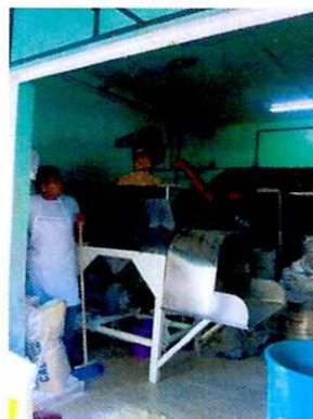
En la imagen se observa el molino en funcionamiento.

En virtud de lo anterior, mediante oficio PAOT-05-300/200-2288-2020, se solicitó a la Dirección General de Control y Administración Urbana de la Secretaría de Desarrollo Urbano y Vivienda de la Ciudad de México, informara si el giro de "molino de granos de maíz" puede homologarse al uso de suelo clasificado como "producción artesanal y microindustria de alimentos (tortillerías, panaderías)". Y si el giro de "molino de granos de maíz" se encuentra como permitido para desarrollarse en el predio ubicado en calle Oriente 102, número 1606, colonia Gabriel Ramos Millán Sección Tlacotal, Alcaldía Iztacalco.