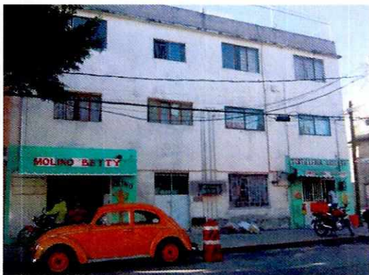
En la imagen se observa la fachada del inmueble.

Por lo anterior, se realizó visita de reconocimiento de hechos en la que se dejó citatorio mediante instructivo fijado en la puerta. En atención a dicho oficio compareció ante esta Procuraduría el apoderado legal de la titular del molino, quien presentó el Certificado Único de Zonificación de Uso del Suelo Digital folio No. 64422-151-HEBE19D, de fecha 11 de noviembre de 2019.