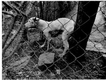
Fotografías 1 y 2. Ejemplar canino denunciado.

Derivado de lo observado por personal de esta Entidad, la persona responsable del ejemplar, entregó de manera voluntaria al ejemplar “Yack” al personal de la Brigada de Vigilancia Animal de la Secretaría de Seguridad Ciudadana de la Ciudad de México, quien se comprometió a proporcionar las condiciones adecuadas de bienestar.