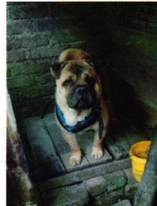
Figuras 4 y 5. Vista del ejemplar canino "Oso".

En virtud de lo antes expuesto, esta Entidad considera procedente emitir la presente resolución, de conformidad con el artículo 27 fracción VII de la Ley Orgánica de esta Procuraduría, por el cumplimiento voluntario de las disposiciones jurídicas en materia de bienestar animal.