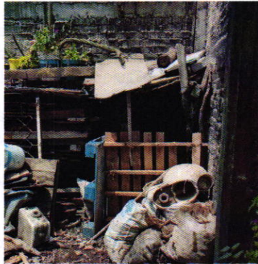
Figura 3. Sitio de alojamiento del ejemplar canino motivo de denuncia.

En seguimiento de lo anterior, personal de esta Subprocuraduría llevó a cabo una nueva visita de reconocimiento de hechos con la finalidad de dar seguimiento a las observaciones antes mencionadas; diligencia durante la cual se constató que el ejemplar canino motivo de denuncia continuaba en la situación antes descrita, motivo por el cual se notificó el oficio PAOT-05-300/200-2851-2021.