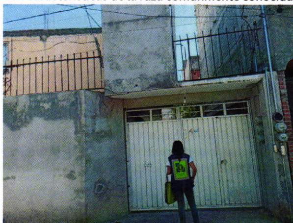
Figura 1. Lugar de los hechos denunciados.

En este sentido, de las constancias que obran en el presente expediente, se desprende que personal de esta Procuraduría llevó a cabo una visita de reconocimiento de hechos, de acuerdo a lo establecido en el artículo 15 BIS 4 fracción IV de la Ley Orgánica de esta Entidad, diligencia durante la cual una persona habitante del lugar donde se denunciaron los hechos objeto de la presente investigación, hizo de conocimiento al personal adscrito a esta Subprocuraduría que en dicha vivienda no existe algún ejemplar canino con las características referidas en el escrito de denuncia. Cabe señalar que el personal de la PAOT constató que efectivamente no había algún ejemplar canino con características de la raza comúnmente conocida como pastor belga.