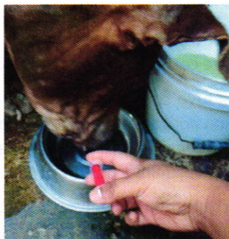
Figura 2. Ejemplar canino motivo de denuncia.

por el médico veterinario encargado de su revisión, así como del tratamiento recomendado para atender la micosis que presenta en la piel.