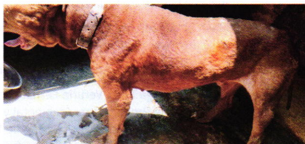
Figuras 3 y 4. Vista del ejemplar canino "Hachiko".

En virtud de lo antes expuesto, esta Entidad considera procedente emitir la presente resolución de conformidad con el artículo 27 fracción VII de la Ley Orgánica de esta Procuraduría, por el cumplimiento voluntario de las disposiciones jurídicas en materia de bienestar animal.