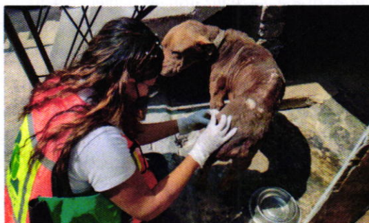
Figura 1. Ejemplar canino motivo de denuncia.

Derivado de lo observado, se realizaron las siguientes recomendaciones: