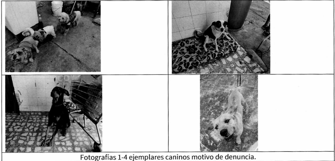
Fotografías 1-4 ejemplares caninos motivo de denuncia.

Es de resaltar que, en el Acuerdo de Admisión, que fue enviado por correo electrónico a las personas denunciantes, se les hizo del conocimiento que contaba con un término de seis días hábiles para aportar las pruebas que estimara pertinentes en la investigación de los hechos, lo anterior conforme al artículo 90 del Reglamento de la Ley Orgánica de la Procuraduría Ambiental y del Ordenamiento Territorial de la Ciudad de México; sin embargo durante el procedimiento de investigación, no fueron proporcionados elementos de prueba que pudieran determinar incumplimiento a la normatividad en materia de bienestar animal.