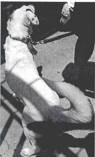
Fotografía 4. Ejemplar que responde al nombre de "Leia"