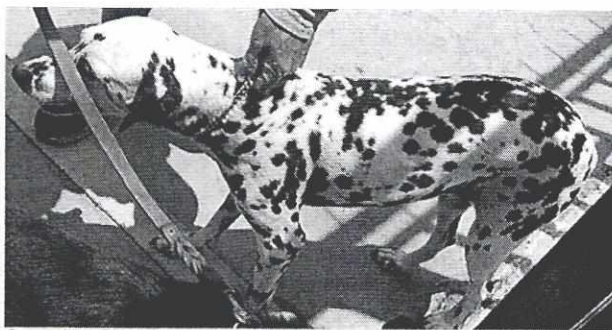
Fotografía 5. Ejemplar que responde al nombre de "Puca"

En virtud de lo antes expuesto, esta Entidad considera procedente emitir la presente resolución, de conformidad con el artículo 27 fracción VI de la Ley Orgánica de esta Procuraduría, por imposibilidad legal, al no constatar irregularidades en materia de bienestar animal.