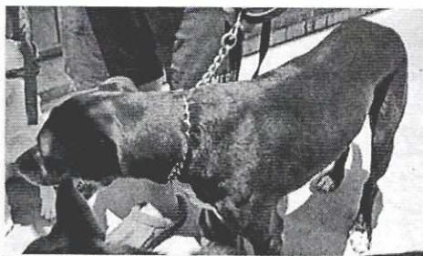
Fotografía 3. Ejemplar que responde al nombre de "Karl-Er"