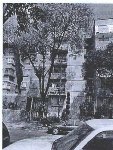
Imagen 4 y 5. Lado del edificio que colinda con la calle J. Roa Bárcenas y sus diferentes balcones.