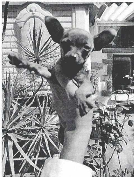
Imagen 2. Ejemplar motivo de denuncia de nombre chocolata.